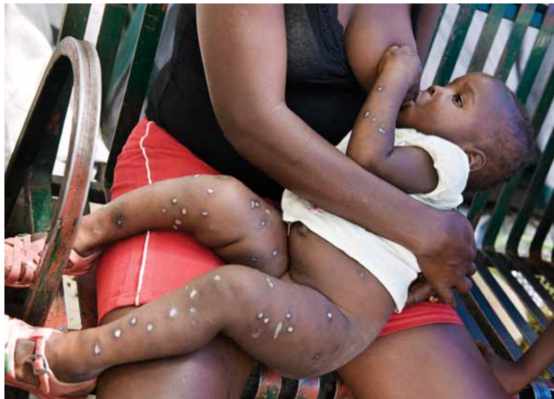
• Utslagen kommer av vattnet, hävdar mamman.

Själv tycker han att den viktigaste frågan är att satsa på utbildning för de unga och utveckla skolsystemet. Han saknar riktiga yrkesskolor. Själv skulle han vilja utbilda sig till busschaufför, det yrke hans egen pappa hade, eller elektriker. Men han har inga pengar, och hans egna studier ligger